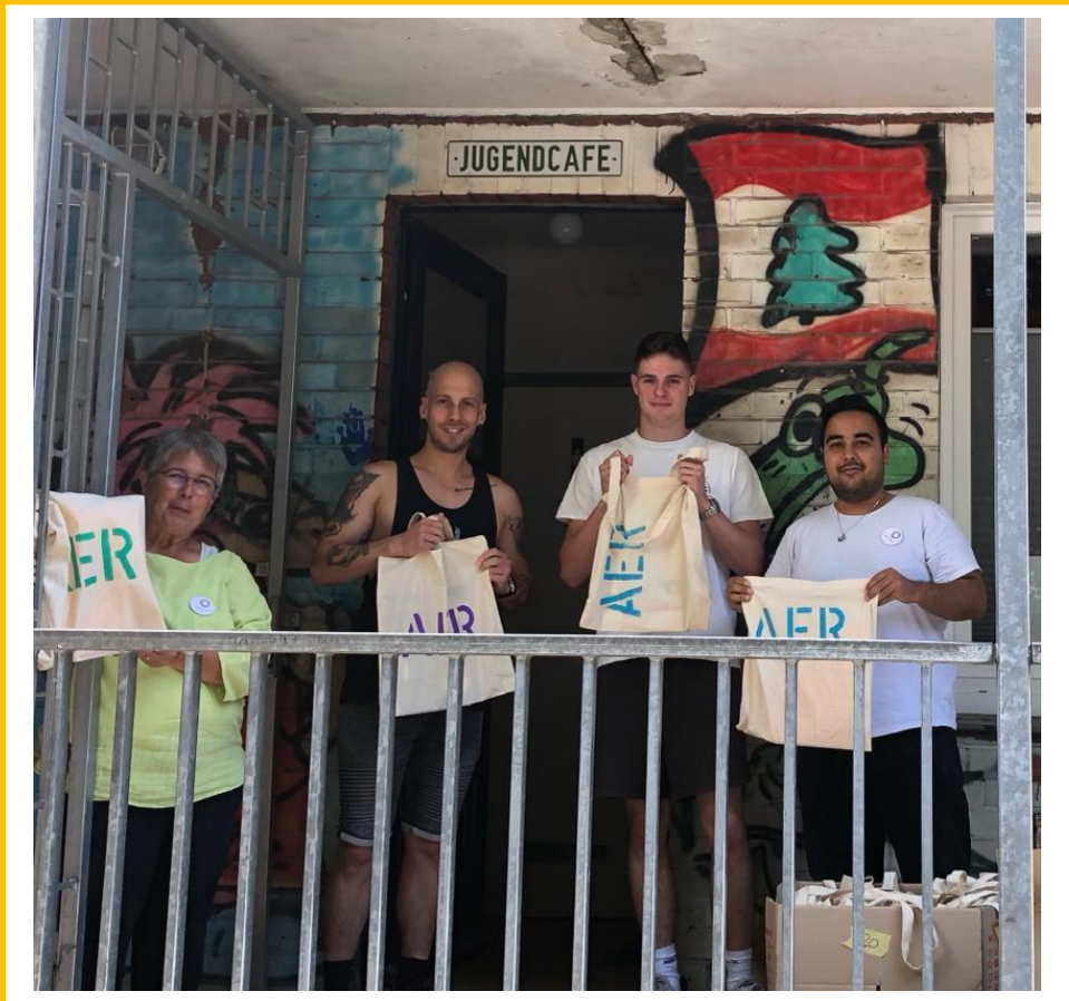
Folge der Story auf Instagram: Flüchtlingshilfebottrop